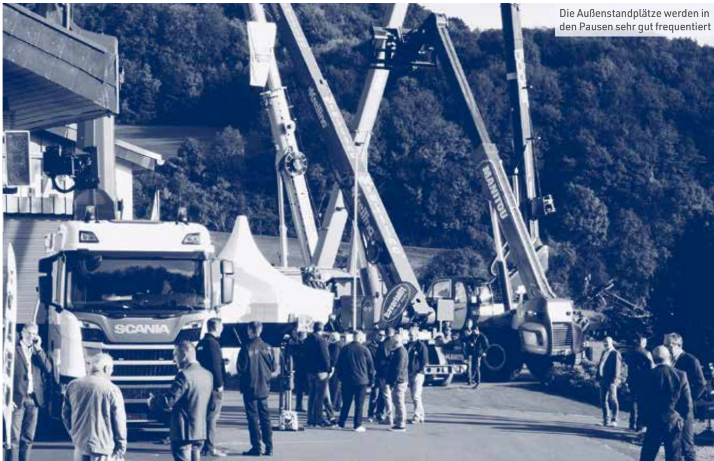
Die Außenstandplätze werden in den Pausen sehr gut frequentiert

Die internationalen Schwerlasttage finden Mitte September in Hohenroda statt. Kran&Bühne sagt, was kommen wird.