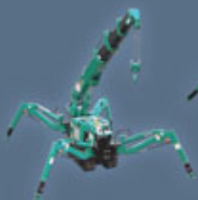
MC104 - 1 Tonnen Minikran Tragfähigkeit: 995 kg/1,1 m Max. Radius: 5,1 m Max. Höhe: 5,5 m Motor: Benzin Elektrisch Benzin/LPG

In Verbindung mit den verschiedensten Lastaufnahmemitteln – zum Beispiel Vakuummontagegeräte für Glas- oder Sandwichelemente, Fassadenplatten u. ä. – die einfach am Haken montiert werden, sind diese Krane universell einsetzbar – bei jedem Projekt! Darüberhinaus kann die gesamte Kranreihe mit Kabel- oder Funkfernsteuerung bedient werden.