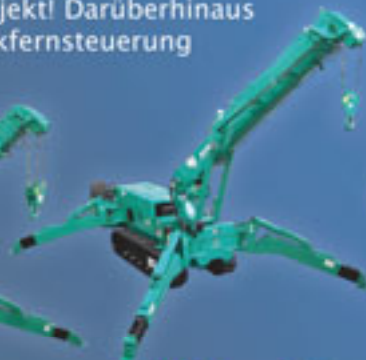
MC405 - 4 Tonnen Minikran Tragfähigkeit: 3830 kg/2,7 m Max. Radius: 16 m Max. Höhe: 16,8 m Motor: Diesel/elektrisch