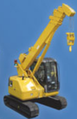
LC785 - 5 Tonnen Minikran Tragfähigkeit: 4900 kg/2,1 m Max. Radius: 14,52 m Max. Höhe: 16,35 m Motor: Diesel

... interessiert??? wenn Sie mehr erfahren wollen und wissen möchten, warum MAEDA die meistverkauften Minikrane der Welt sind ..