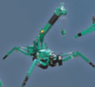
MC285 - 2,8 Tonnen Minikran Tragfähigkeit: 2820 kg/1,4 m Max. Radius: 8,21 m Max. Höhe: 8,7 m Motor: Diesel/elektrisch