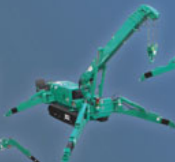
MC305 - 3 Tonnen Minikran Tragfähigkeit: 2980 kg/4 m Max. Radius: 12,16 m Max. Höhe: 12,66 m Motor: Diesel/elektrisch