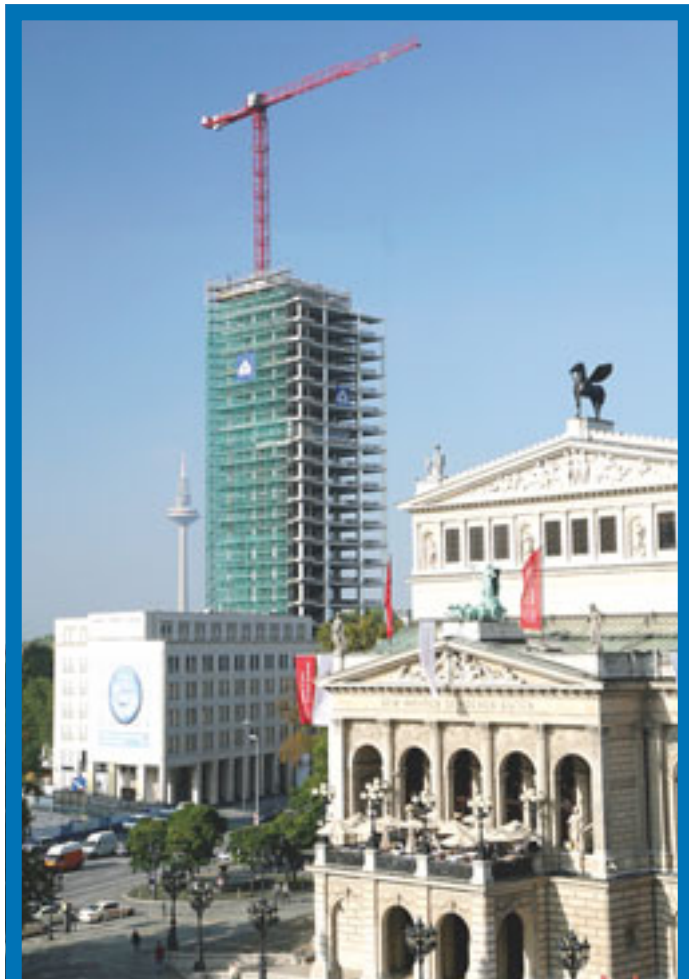
Wilberts WT 200 e.tronic hat 20 Monate lang seinen Job bei Sanierung und Erweiterung des Tectum Tower in Frankfurt erledigt. Von Dezember 2005 bis August 2007 wurde der Turmdrehkran mit 123 Metern Hakenhöhe mitten in der Frankfurter Innenstadt eingesetzt. Obwohl diese Hakenhöhe auch ohne Gebäudeabspannung hätte erreicht werden können, entschied man sich der Firma Wilbert zufolge für einen schlankeren Turm mit einer Gebäudeabspannung in 75 Metern Höhe.