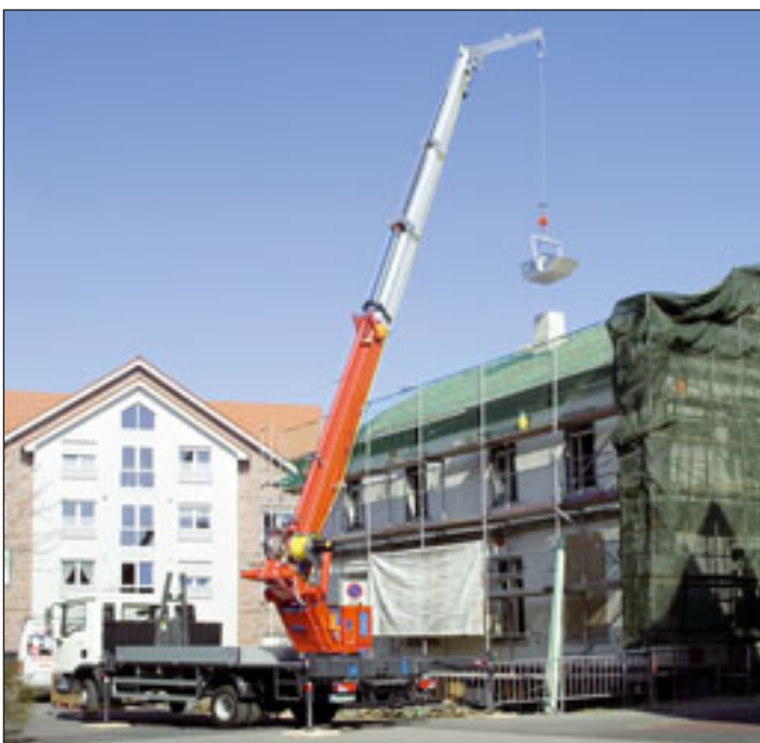
Variable Abstützungssysteme bietet Böcker auch für seine LKW-Krane an

Mit dem neuen Euro 262.6 visiert Tirre Krantechnik neue Dimensionen in der Hochkranlogistik an. Mit 6-fachem Ausschub und 3-fach Jib erreicht der Baustoffkran 23,70 Meter Ausladung. Die Knickkante der Jib-Verlängerung liegt hierbei in rund 20 Meter Höhe.