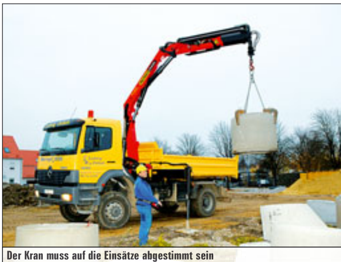
Der Kran muss auf die Einsätze abgestimmt sein