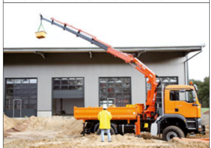
Der 190.2E ist nur einer von 230 Varianten bei Terex-Atlas