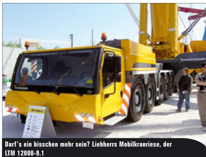
Darf's ein bisschen mehr sein? Liebherr's Mobilkranriese, der LTM 12000-9.1

Bei den Arbeitsbühnen fiel zudem Ruthmanns LKW-Bühne T 580 auf, insbesondere der gerundete Ausleger. Mit einem Seitenhieb teilte Time Versalift mit, dass demnächst LKW-Bühne Nr. 100000 gefertigt würde. Mit zwei neuen Bühnen war Merlo in München am Start, darunter die