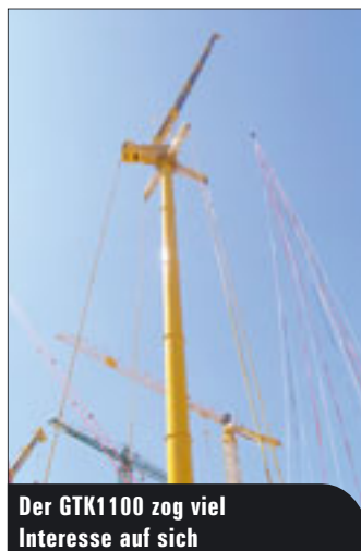
Der GTK1100 zog viel Interesse auf sich

« ein großes Potenzial. Für CFK sprechen das geringere Gewicht, die höhere Tragfähigkeit und die hundertprozentige Verschleißfreiheit. Bei den Anschlagmitteln bietet Unitex mit DSM Dyneema die „stärkste Faser der Welt“ an und verspricht höchste Festigkeit bei geringstem Gewicht. Und – ebenso neu: Genie gewährt nun zwei Jahre Garantie auf alles, auf die Konstruktion sogar fünf Jahre.