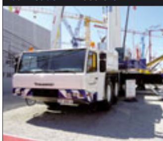
Neues Flaggschiff von Tadano Faun ist der ATF 360 G-6

Nichtsdestotrotz präsentierten sich Produzenten aus Fernost zum ersten Mal ausführlich auf der bauma: Ladekrane von Soosan aus Korea, Turmkrane von Yongmao, Raupenkrane und Reachstacker von Sany oder Mobilkrane von Zoomlion, allesamt made in Chi-