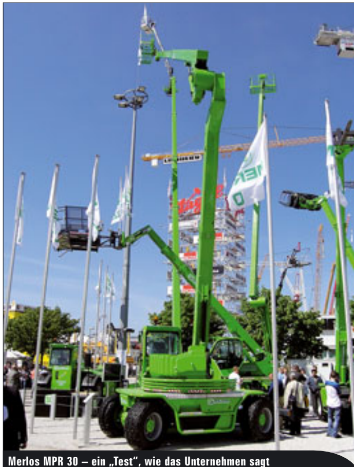
Merlos MPR 30 – ein „Test“, wie das Unternehmen sagt

Bison Palfinger hat das erste Modell der neuen TA-Baureihe vorgestellt, die TA 25 Business. Das neue Modell mit 24,5 Metern Arbeitshöhe auf 3,5-Tonnen-Chassis überrascht mit einigen Details. So besteht die Plattform, die den Unterwagen abdeckt, aus einem neuen Glasfaserverbund-Werkstoff. Eine seitliche „Wendeltreppe“ führt jetzt bequem auf die Plattform und von dort aus in den Korb.