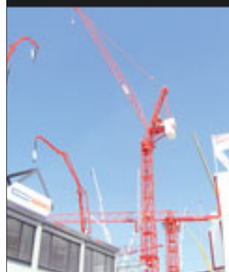
Bei 60 Meter Ausladung hebt der neue Wolff 355 B noch vier Tonnen

Doch viel Neues steckte auch im Detail. Zum Beispiel Tadanos „Release Adjuster“ für mehr Stabilität beim Lastabsenken. Oder in der Funktechnik: Hirschmann setzt bei Mobilkranen mittlerweile auf Ethernet statt auf BUS-Verbindungen. Nehmen wir die Werkstoffe: Liebherr setzte bei den Haltestangen des LR 1300 statt Stahl erstmalig Kohlefaser ein und attestiert dieser Technologie