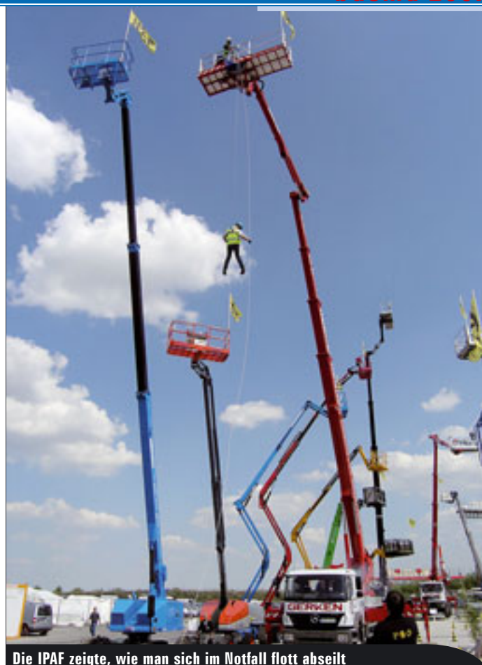
Die IPAF zeigte, wie man sich im Notfall flott abseilt

Wie gewohnt mit eigenem Stand am Start: der Vertikal Verlag