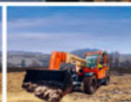
JLG Teleskopstapler mit Allradantrieb