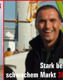
Stark bei schwachem Markt 38