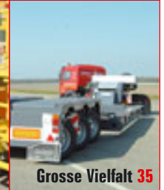
Grosse Vielfalt 35