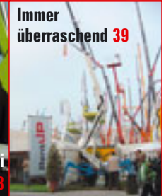
Immer überraschend 39