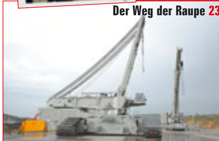
Der Weg der Raupe 23