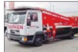
LKW-Teleskopbühne Ruthmann TL 300 E auf MAN 8.163, Bj: 1997, Arbeitshöhe: 30 m, seilf.Reichweite: 18,90 m, Hublast: 200 kg, Gewicht: 7.380 kg, Diesel, Bauhöhe nur 2,75 m