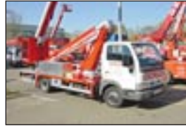
LKW-Teleskopbühne Multitel 160 Alu auf Nissan Cabstar, Bj: 2003, Arbeitshöhe: 16 m, seilf.Reichweite: 10,30 m, Hublast: 200 kg, Gewicht: 3.350 kg, Diesel, kompakte Bauweise.