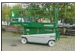
Scherenbühne Condor V 3148 XL, Bj: 2000, Arbeitshöhe: 11,50 m, Hublast: 340 kg, Gewicht: 2.200 kg, Batterie, verschiebbare Plattform, abriebfreie Reifen