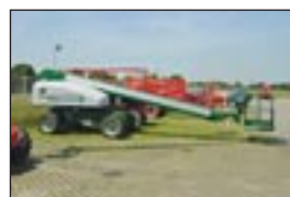
Teleskopbühne Condor T 60, Bj: 1999 & 2000, Arbeitshöhe: 20,30 m, Hublast: 227 kg, Gewicht: 9.200 kg, Diesel, Allrad, drehbarer Korb, volle Höhe verfahrbar