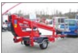
Anhängerbühne Dino 150 T, Bj: 2002, Arbeitshöhe: 15 m, seilf.Reichweite: 10 m, Hublast: 215 kg, Gewicht: 1.620 kg, hydraul.Stützen, Fahrtrieb.