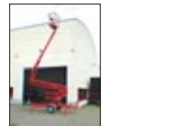
Anhängerbühne Euro Access MB 12-40, Bj: 1999, Arbeitshöhe: 12 m, seilf.Reichweite: 4,70 m, Hublast: 215 kg, Gewicht: 1.140 kg, 220 Volt, hydraulische Stützen.