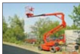
Gelenkteleskopbühne Euro Access MZ 13-42 SP, Bj: 1998, Arbeitshöhe: 13,20 m, Hublast: 215 kg, Gewicht: 3.600 kg, Diesel, Proportionalsteuerung.