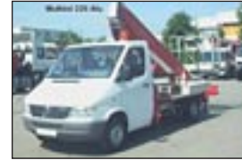
LKW-Teleskopbühne Multitel 220 Alu auf MB 311, Bj: 2001, Arbeitshöhe: 22,10 m, seilf.Reichweite: 10 m, Hublast: 200 kg, Gewicht: 3.500 kg, Diesel, drehbarer Korb, hydraul. Stützen.