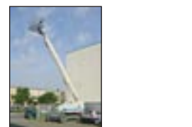
Teleskopbühne Terex TB 100, Bj: 1999 & 2000, Arbeitshöhe: 32,50 m, Hublast: 200 kg, Gewicht: 17.830 kg, Diesel, Allrad, drehbarer Korb.