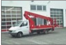
LKW-Teleskopbühne Ruthmann TL 140 auf MB 308, Bj.:1995 & 96, Arbeitshöhe: 16 m, seilf.Reichweite: 11,70 m, Hublast: 200 kg, Gewicht: 3.240 kg, Diesel, 220 V im Korb.