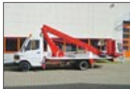
LKW-Teleskopbühne Wumag WT 185 auf MB 410, Bj: 1994, Arbeitshöhe: 18,50 m, seilf.Reichweite: 9,50 m, Hublast: 200 kg, Gewicht: 4.300 kg, Diesel, schräge Stützung,ATM in 2003