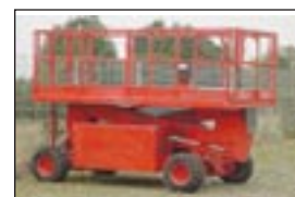
Scherenbühne Upright Speed Level SL26SL, Bj: 1995, Arbeitshöhe: 10 m, Hublast: 680 kg, Gewicht: 2.853 kg, Diesel, Allrad, Pendelachse, mehrfach vorhanden