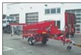
Anhängerbühne Denka MK 25, Bj: 2000, Arbeitshöhe: 25 m, seilf.Reichweite: 11,40 m, Hublast: 200 kg, Gewicht: 2.310 kg, 220 Volt, hydraulische Stützen, Fahrtrieb.