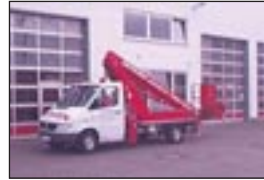
LKW-Teleskopbühne Wumag WT 175 auf MB 308, Bj.: 1999, Arbeitshöhe: 17,50 m, seilf.Reichweite: 8,30 m, Hublast: 200 kg, Gewicht: 3.345 kg, Diesel, hydraul. Stützen.