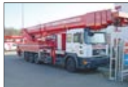
LKW-Teleskopbühne Ruthmann TU 700 auf MAN 26.403, Bj: 1997, Arbeitshöhe: 69,70 m, seilf.Reichweite: 34 m, Hublast: 360 kg, Gewicht: 32.500 kg, Diesel, drehbarer Korb, Korbarm.