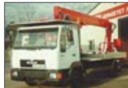
LKW-Teleskopbühne GSR 220 TJ auf MAN 8.153, Bj: 1996, Arbeitshöhe: 22 m, seilf.Reichweite: 13 m, Hublast: 200 kg, Gewicht: 7.210 kg, Diesel, drehbarer Korb, Korbarm.