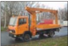
LKW-Teleskopbühne Ruthmann K 115 auf MB 709, Bj: 1986, Arbeitshöhe: 14,50 m, seilf.Reichweite: 8,50 m, Hublast: 200 kg, Gewicht: 6.500 kg, Diesel, hydraul.Stützen.