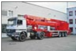
LKW-Teleskopbühne Ruthmann TTS 590 auf MB 2043, Bj: 1987/2001, Arbeitshöhe: 60 m, seilf.Reichweite: 29 m, Hublast: 500 kg, Gewicht: 41.800 kg, Diesel, generalüberholt in 2001.