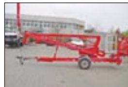
Anhängerarbeitsbühne Litra 120 G, Bj: 2000, Arbeitshöhe: 12 m, seilf.Reichweite: 4,50 m, Hublast: 215 kg, Gewicht: 1.200 kg, 220 Volt, hydraulische Stützen.