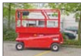
Scherenbühne Condor V 2053 XL, Bj: 2000, Arbeitshöhe: 8,10 m, Hublast: 567 kg, Gewicht: 2.100 kg, Batterie, ausgesch. Reifen, Prop.-Steuerung.