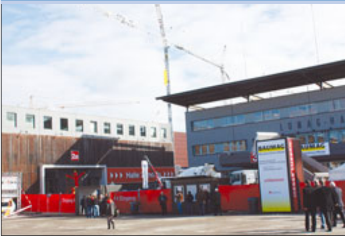
Auf geht's zur 16. Ausgabe

◀ Für Kranfreunde sind die Stände der Firmen Condicta, Huggler, Nellos Kranservice und Senn zu empfehlen. Anhänger von Arbeitsbühnen können zu Alcllic, Wolf Produkte und WS Skyworkerpilgern. Für Alukrane sind die Namen Böcker und Schär bekannt. Bei den Unternehmen Arbor, Baurent