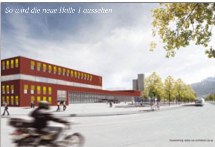
So wird die neue Halle 1 aussehen

Neubau beherbergt auch ein Konferenzzentrum: Dessen Foyer gestattet einen Blick auf den Pilatus mit seinen über 2.000 Meter hohen Gipfeln.