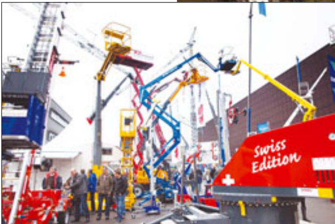
Natürlich handelt es sich bei der Baumag um eine ‚Swiss Edition‘