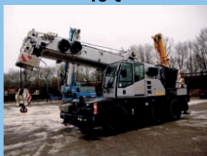
Demag AC 40, 2005