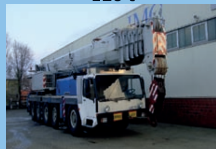
Liebherr LTM 1120, 1997