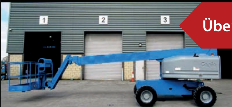
Genie S-45 4WS, 2005, 1940 Betriebsstunden €21,500