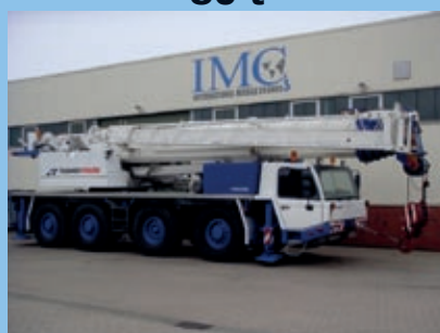
Tadano Faun ATF 80-4, 2002