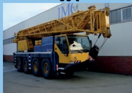
Liebherr LTM 1060-2, 2001