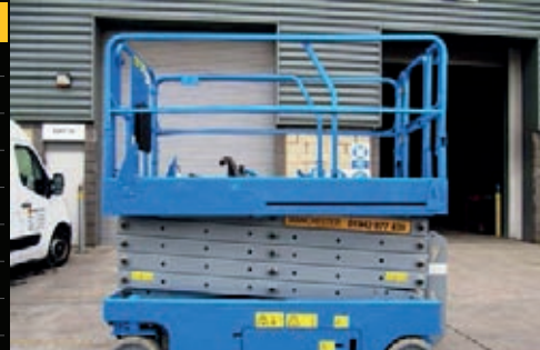
Genie GS-3246, 2005, 611 Betriebsstunden, €6,950