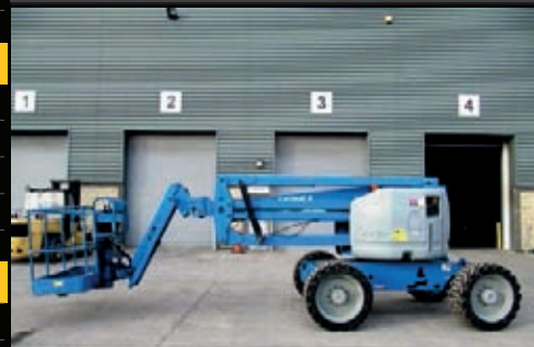
Genie Z-45/25J RT, 2007, 1734 Betriebsstunden, €26,000