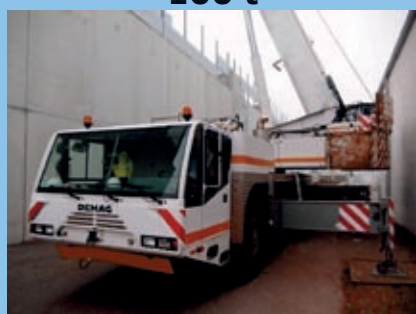
Demag 100, 2000 50 t