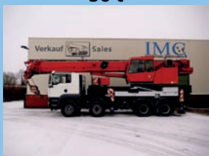
Tadano Faun HK 50, 2007