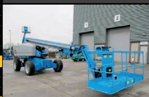
Genie S-65 4WD, 2005, 2950 Betriebsstunden, €32,500