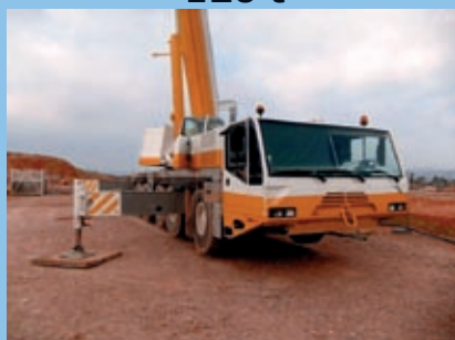
Demag AC 120, 2001