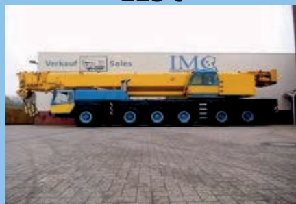
Liebherr LTM 1225, 1999 mit Superlift 100 t