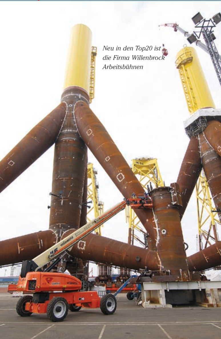
Neu in den Top20 ist die Firma Willenbrock Arbeitsbühnen