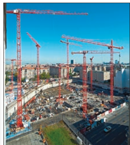
Auch in der Hauptstadt treten die „Wölffe“ bisweilen im Rudel auf wie hier am Leipziger Platz

gleich bleiben. Aber es gibt eben auch die Geschichten derjenigen Unternehmen, die ordentlich, kraftvoll oder sogar sagenhaft gewachsen sind. Bis die Krane oder Arbeitsbühnen am Firmament kratzen. ▶▶