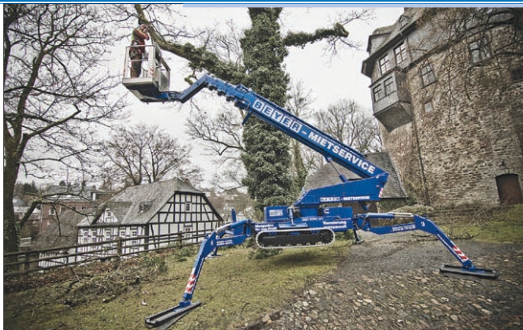
Um zuletzt 120 Bühnen hat Beyer Mietservice aufgestockt, darunter auch viele Teupen-Raupen

Bestes Beispiel: die Arbeitsbühnen. Wenn hier in Deutschland einer jammert, dann auf hohem Niveau (den langen Winter einmal ausgenommen). Wie die jüngsten Zahlen der IPAF zeigen, ist Deutschland 2012 einer der prosperierenden Märkte in Europa gewesen, hier haben die Vermieter Zuwächse bei den Mieteinnahmen erzielt. Die Schweiz und Österreich wurden in diesem Bericht nicht untersucht. Bei uns schon: Die Schweizer Nr. 1, die UP AG, hat sich rund 70 neue Arbeitsbühnen zugelegt und ihre Gesamtarbeitshöhe so um 500 Meter gesteigert. Maltech aus Österreich kommt auf hundert neue Bühnen und ein Plus von 2,5 Kilometern. Mateco hat im Jahresvergleich 175 neue Maschinen angeschafft, davon an die hundert LKW-Bühnen – das