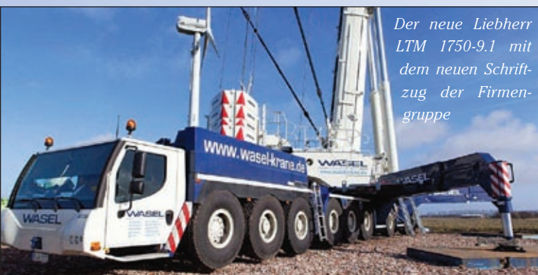
Der neue Liebherr LTM 1750-9.1 mit dem neuen Schriftzug der Firmengruppe