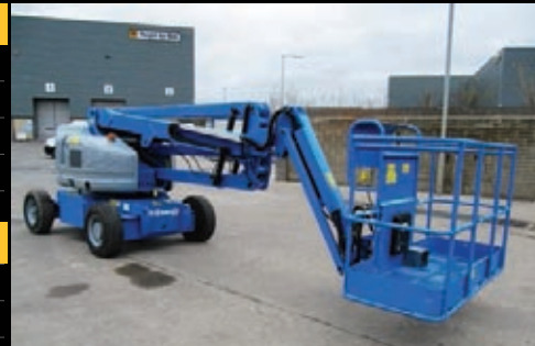
Genie Z-45/25J Bi, 2006, 588 Betriebsstunden, €21,000