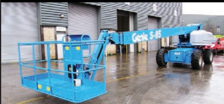
Genie S-85 4WD, 2005, 2646 Betriebsstunden, €48,000