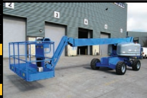
Genie S-45 4WD, 2005, 3592 Betriebsstunden, €21,500