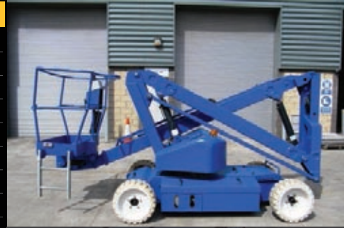
Upright AB38, 2005, €12,500