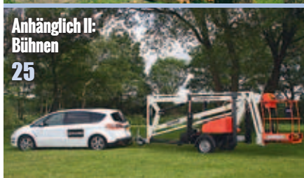
Anhänglich II: Bühnen 25