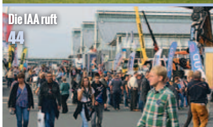
Die IAA ruft 44