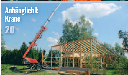
Anhänglich I: Krane 20