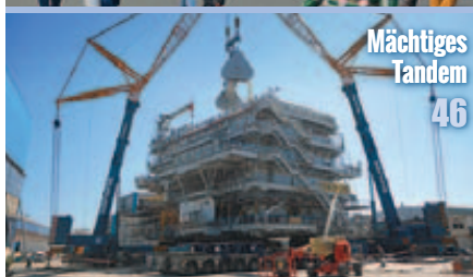
Mächtiges Tandem 46