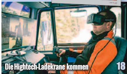
Die Hightech-Ladekrane kommen 18