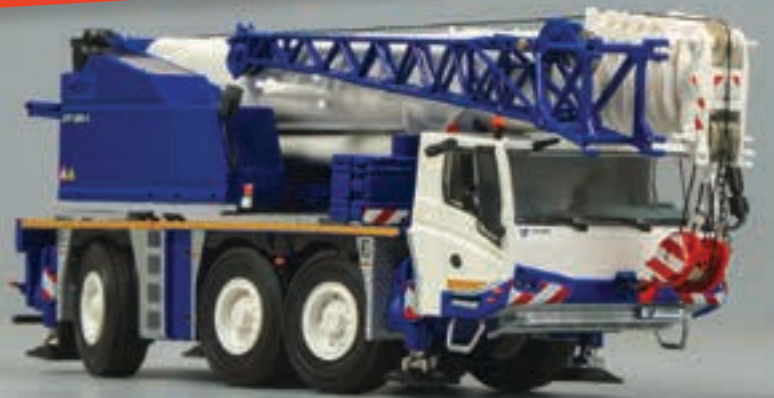
Das Modell in Fahrtstellung