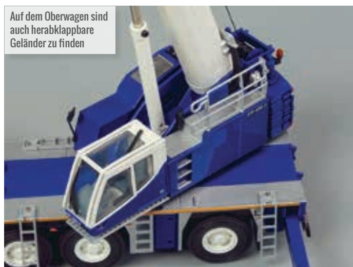
Auf dem Oberwagen sind auch herabklappbare Geländer zu finden

Ebenso mit einem Schlüssel wird die Hauptwinde betätigt. Diese funktioniert sehr gut und hat eine Federwirkung, um die Bremse zu lösen. Zwei Metallhaken gehören mit zum Paket und sind wunderbar gestaltet. Die kleine Metallgitterverlängerung kann versetzt werden und ist mit Metallscheiben ausgestattet.