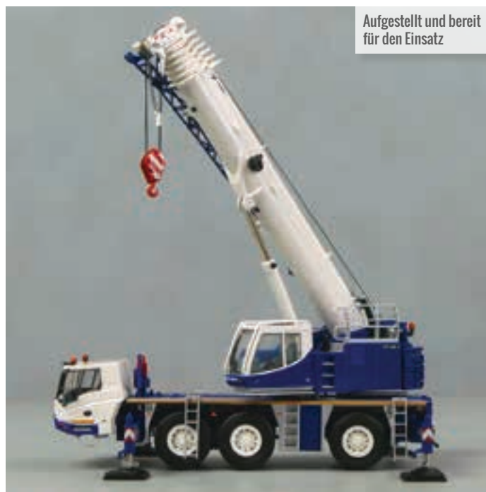
Aufgestellt und bereit für den Einsatz

Das Gegengewicht besteht aus einzelnen Elementen, die auch mit Hebepunkten ausgestattet sind. Der Zylinder des Hauptauslegers erscheint in einem schönen metallenen Farbton. Auch die einzelnen Auslegerabschnitte zeigen realistisch aussehende Wandstärken, die insgesamt ein sehr gutes Profil ergeben. Das Anheben des Auslegers ist dank des Verriegelungsmechanismus am Hubzylinder einfach. Die Verriegelung wird mittels eines Schlüssels gewährleistet. Federklammern verriegeln jedes Auslegersegment bei ca. 50 Prozent und bei voller Ausladung.