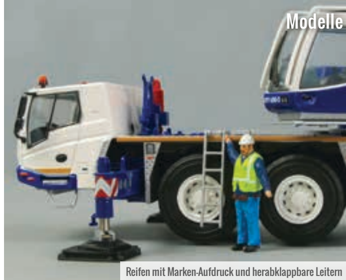
Reifen mit Marken-Aufdruck und herabklappbare Leitern