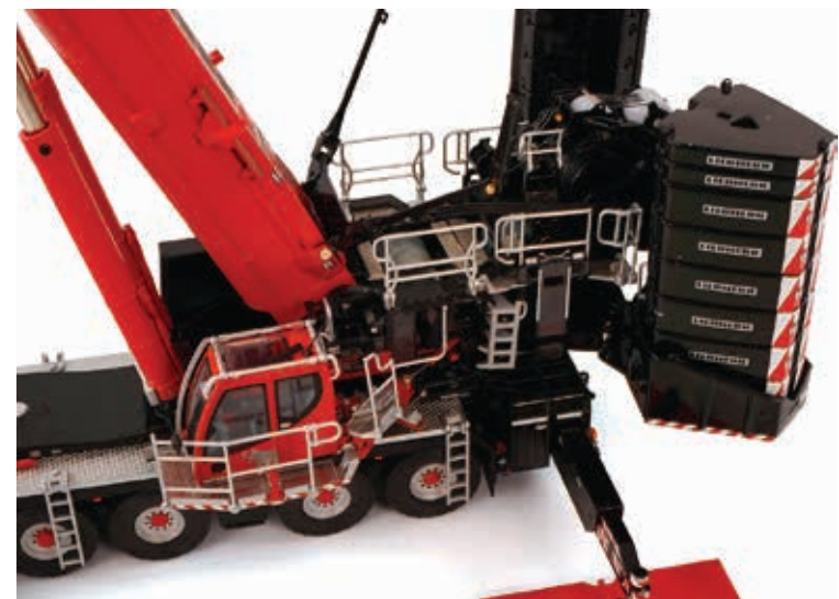
Detailreichtum: So lassen sich die Geländer über der Winde abklappen