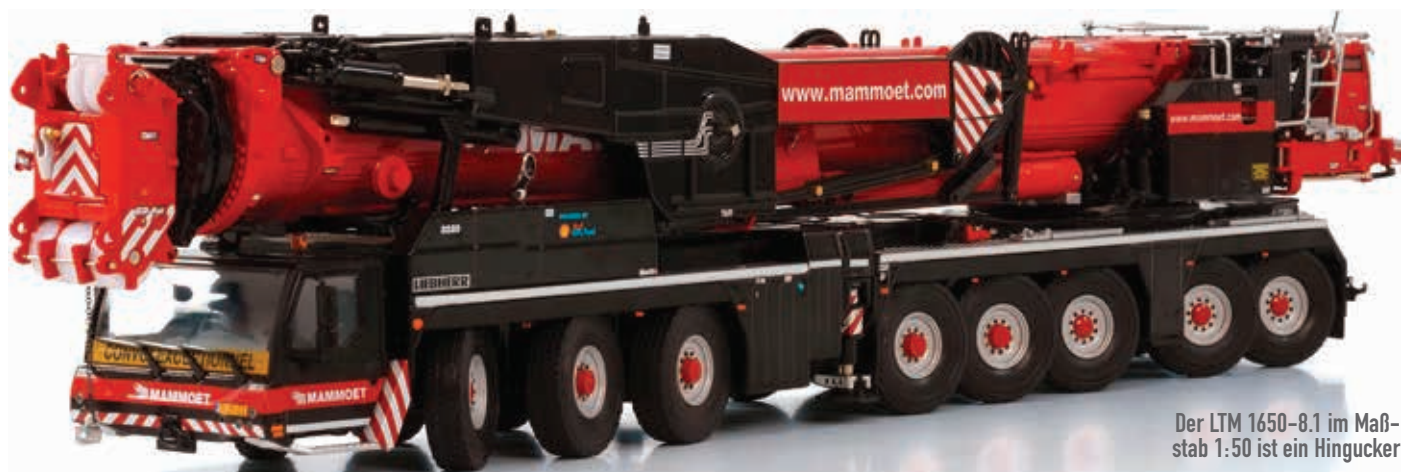
Der LTM 1650-8.1 im Maßstab 1:50 ist ein Hingucker