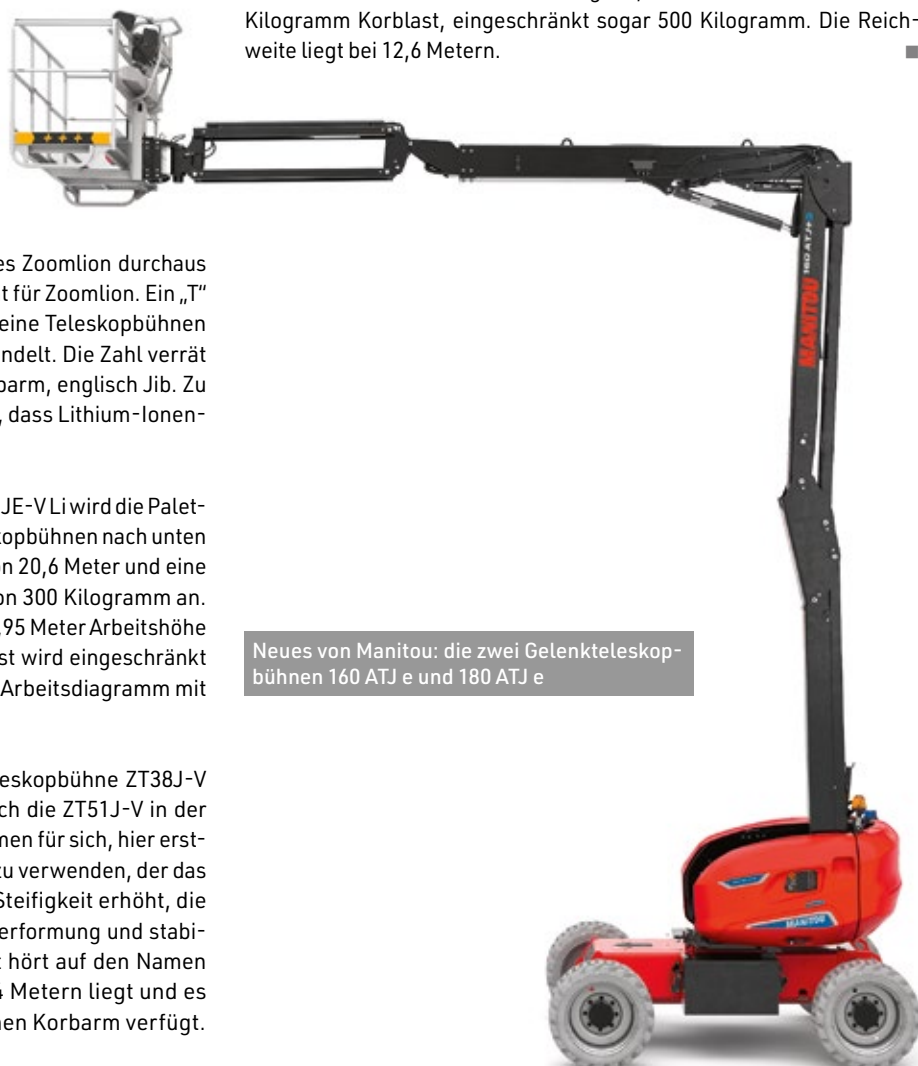
Neues von Manitou: die zwei Gelenkteleskopbühnen 160 ATJ e und 180 ATJ e

Zum Schluss möchte ich Sie noch aufs Gleis führen. Für Arbeiten am Schienennetz ist es notwendig, auch auf Gleisen fahren zu können. Eine solche Zweibein-Maschine hat Platform Basket vorgestellt und wird hierzulande über Kunze Arbeitsbühne vermarktet. Mit der RR19-500 sind Arbeitshöhen von 19 Meter möglich, und das mit mindestens 400 Kilogramm Korblast, eingeschränkt sogar 500 Kilogramm. Die Reichweite liegt bei 12,6 Metern.