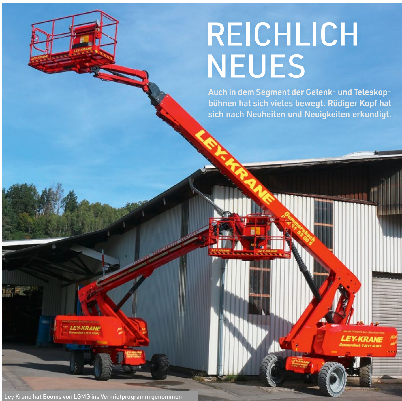
Ley Krane hat Booms von LGMG ins Vermietprogramm genommen