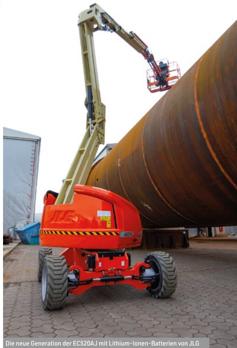
Die neue Generation der EC520AJ mit Lithium-Ionen-Batterien von JLG

Keine Angst, ich mache Ihnen an dieser Stelle kein X für ein U vor. Es ist die Namensgebung in Kombination mit der Übersetzung der chinesischen Schriftzeichen in die hier in Europa gebräuchlichen arabischen Schriftzeichen. Da kann es leicht zu Ähnlichkeiten kommen, wenn es plötzlich um XCMG geht oder wie die Langform heißt: Xuzhou Construction Machinery Group. Auch dieses Unternehmen hat inzwischen eine europäische Niederlassung, die sich in Krefeld befindet. Wie der Name verrät, sind nicht nur Arbeitsbühnen im Gesamtkonzern zu finden, auch weitere Baumaschinen. In Sachen Gelenk- und Teleskopbühnen wird durchaus eine breite Palette angeboten. Für das Segment der Gelenkbühnen beispielsweise gibt es die XGA12ACK. Hinter den vielen Buchstaben und Zahlen versteckt sich ein Elektrogelenkteleskop mit 11,56 Meter Arbeitshöhe und einem Gelenkpunkt von rund fünf Metern. Im Bereich der Teleskopbühnen zeigt das größte Modell das Selbstverständnis des Unternehmens: Mit einer Arbeitshöhe von 69,96 Metern ist die XGS70K die weltweit größte Teleskopbühne. Sie wiegt 35,4 Tonnen. Die Transportlänge liegt bei 16 Metern und die Transporthöhe bei 3,07 Metern. Zweifelsohne ein Gerät für nicht alltägliche Einsätze mit guter Zugänglichkeit.