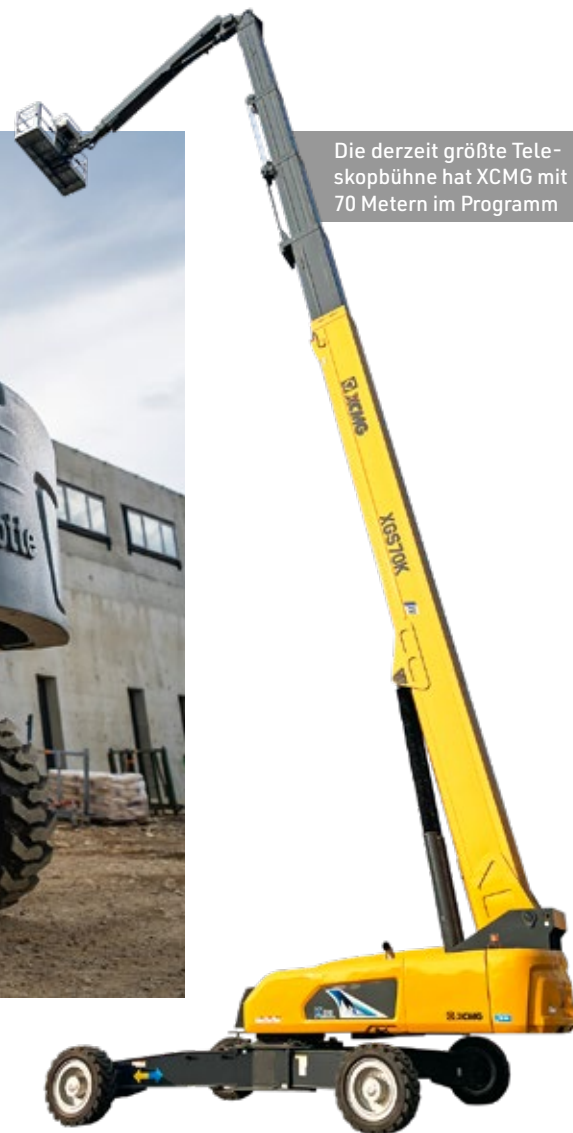
Die derzeit größte Teleskopbühne hat XCMG mit 70 Metern im Programm

Skyjack hat sich vor wenigen Jahren wieder verstärkt dem Thema der Gelenk- und Teleskopbühnen zugewandt. In einem ersten Schritt kamen sukzessive insgesamt sieben Modelle auf den Markt, die Arbeitshöhen von 11 bis 28 Metern abdecken, auf den Markt. Besonders bei den Standardgeräten mit Höhen 15 und 22 Metern wurde die Korblast auf 300 Kilogramm für den gesamten Arbeitsbereich und eingeschränkt bis 454 Kilogramm erhöht. Eine Arbeitsbühne kann ihre Effizienz noch weiter steigern, wenn die Anbauelemente entsprechende Vorteile generieren. Bei Skyjack nennt sich das „Smartorque-Konstruktionsphilosophie“. Dabei floss auch das Feedback von Kunden und Anwendern mit ein. Dank eines optimierten Getriebes und eines vereinfachten Hydraulikpakets können die Maschinen laut Hersteller nun mit kleineren Motoren und weniger komplexen Nachbehandlungskomponenten ausgestattet werden, um auf der Baustelle eine ähnliche Leistung zu erbringen wie nominell leistungsstärkere Geräte. Mit diesen Änderungen können Vermietunternehmen ihre Investitionsrendite schnell verbessern und die Kosten senken. Gemäß dem Motto „Simplify your life“ – vereinfache dein Leben – gibt es jetzt weniger Komponenten in der Maschine, was Wartung und Austausch reduziert. Nebenbei sinkt auch der Spritverbrauch.