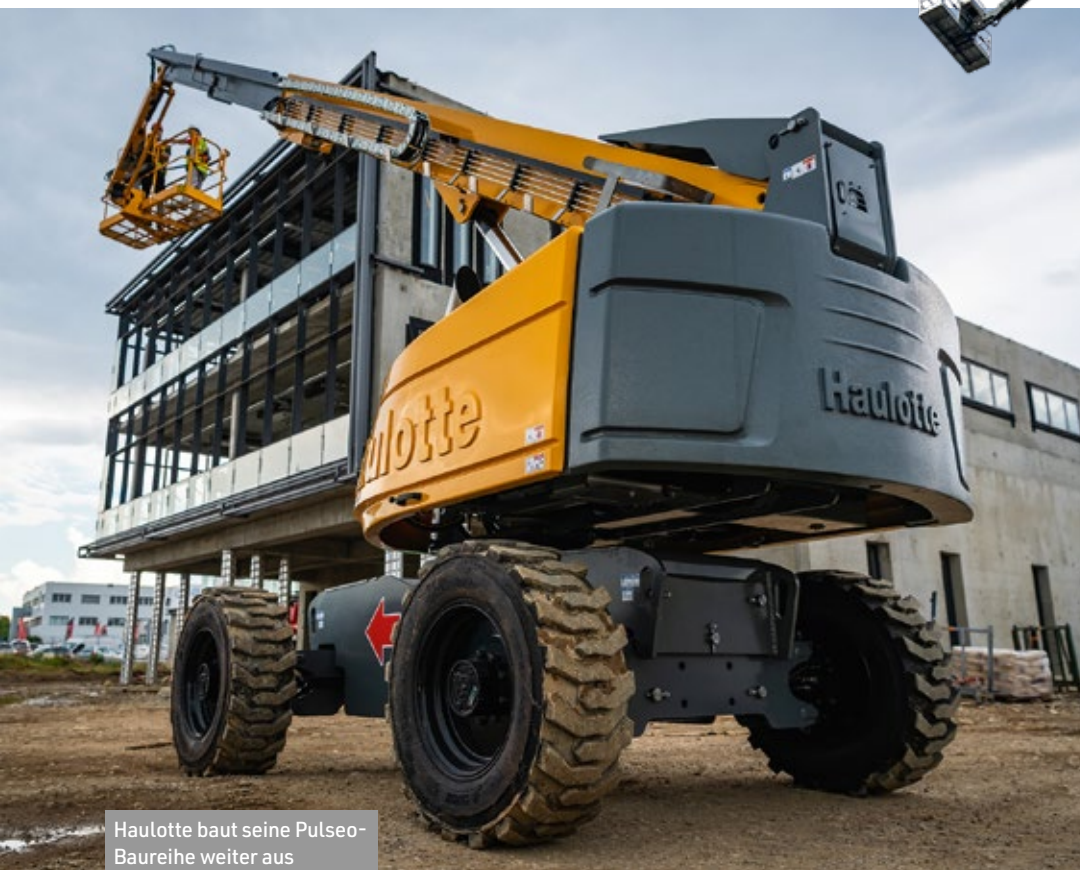
Haulotte baut seine Pulseo-Baureihe weiter aus