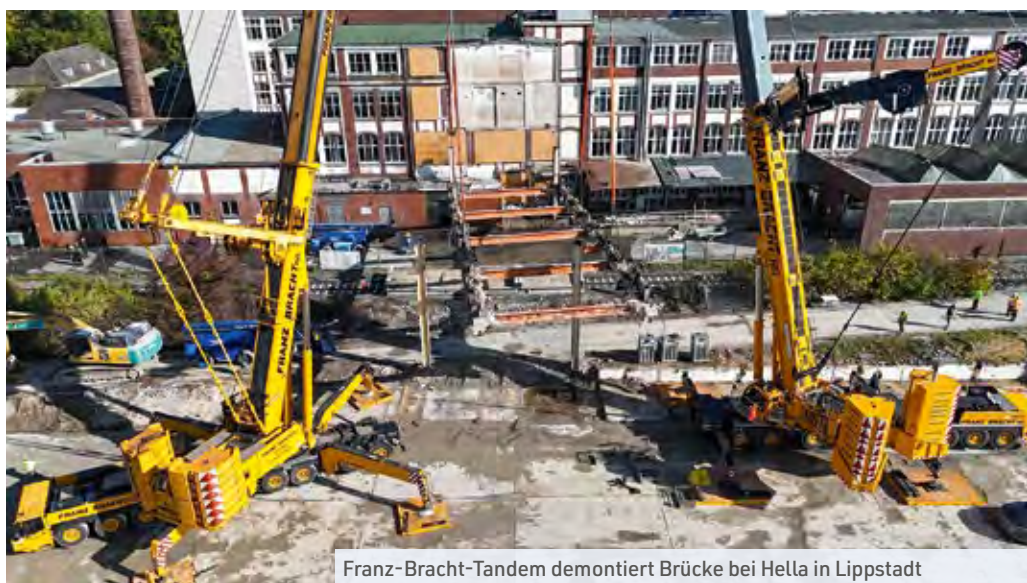
Franz-Bracht-Tandem demontiert Brücke bei Hella in Lippstadt

reiche Konzept gewonnen wurde, umfasste die Demontage und den Austausch einer Rohrbrücke mithilfe eines 500 Tonnen starken Teleskopkrans und wurde ebenso reibungslos umgesetzt.