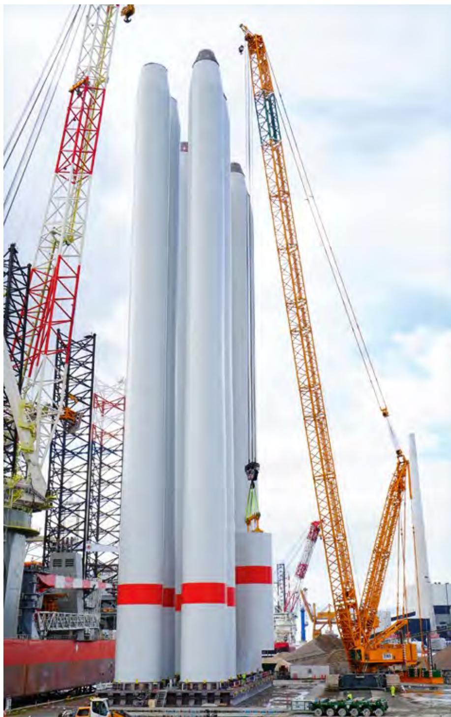
LR 11350 von BMS montiert 106 rund 110 Meter hohe Türme für Windkraftanlagen in Dänemark

Der dänische Heavy-Lift-Spezialist BMS setzt drei Liebherr-Riesenraupenkrane LR 11350 in SDB-Konfiguration mit 132-Meter-Hauptausleger und 42-Meter-Derrick bei einem gigantischen Offshore-Windkraftauftrag in Esbjerg, Dänemark, ein. Der Gittermastraupenkrane LR 1750/2, mit 750 Tonnen maximaler Tragkraft auch kein Kleinkrane, kommt hier lediglich als Hilfskrane zum Einsatz. BMS Heavy Cranes hat dort bis Ende 2024 insgesamt 106 Windkrafttürme montiert.