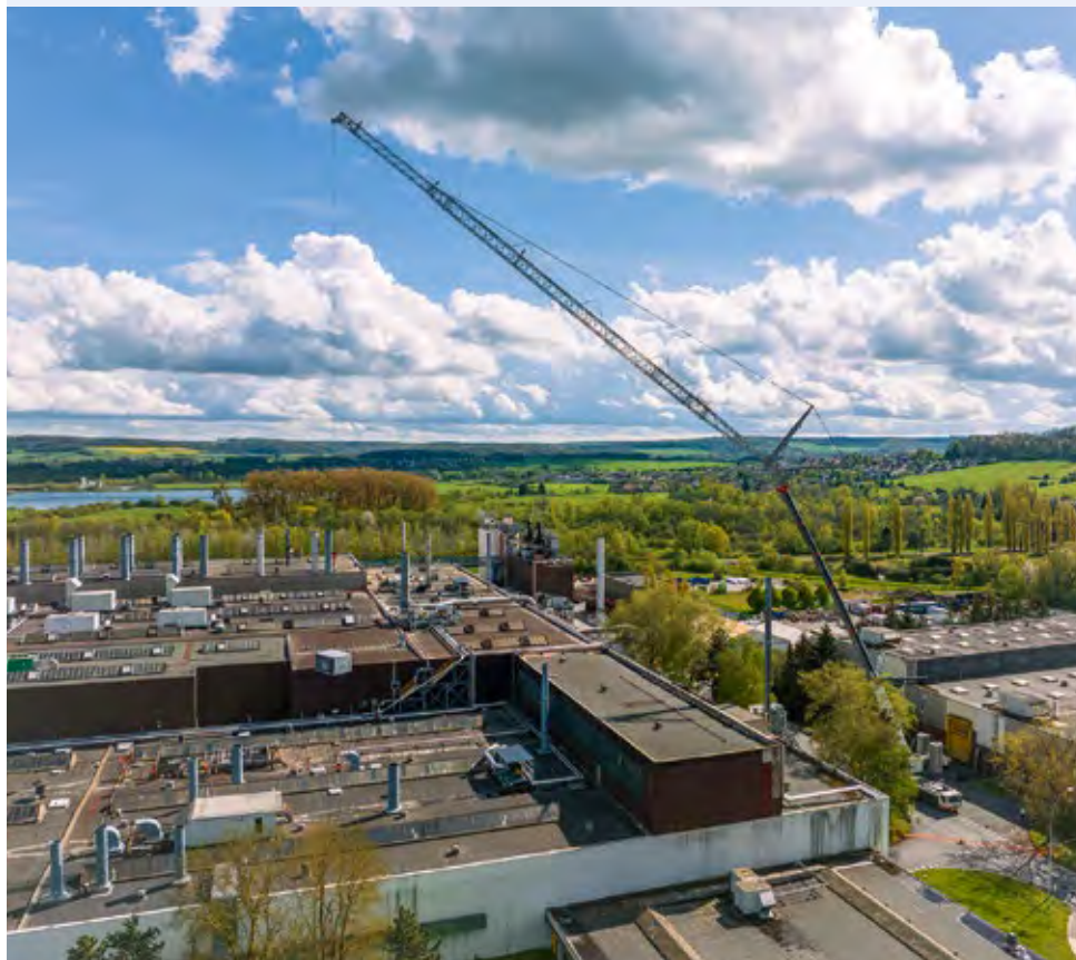
Tadano AC 7.450-1 hebt Lüftungsanlage bei Stellantis in den Ardennen aufs Dach