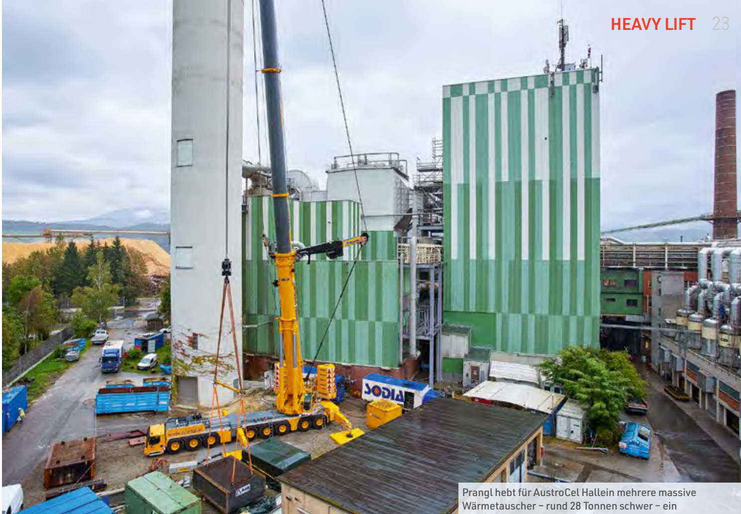
Prangl hebt für AustroCel Hallein mehrere massive Wärmetauscher – rund 28 Tonnen schwer – ein

tete das Felbermayr-Team von Mitte April bis Ende Oktober. „Zwischen den Hübten mussten wir Pause machen, da die neuen Brückenteile vor Ort zusammengebaut wurden“, erläutert Maier-Bauer. Insgesamt sieben Elemente mit bis zu 180 Tonnen und bis zu 62 Metern Länge wurden zunächst mittels SPMT ( Self-Propelled Modular Transporter ) vom Montageplatz zu den Kranen transportiert. „Den Hub für das erste überirdisch gelegene Brückenelement haben wir mit einem 350-Tonner und einem 250-Tonner ausgeführt. Vom ersten Übergabeturm in 13 Metern Höhe mussten wir dann auf stärkere Hebertechnik umsteigen“, berichtet der Experte weiter. Somit kamen vier weitere Mobil- und Raupenkranen mit Hakenhöhen bis zu 43 Metern und 800 Tonnen maximaler Traglast zum Einsatz. Mit einem Liebherr LR 1300 – einem Raupenkran mit fix angebaute 62 Meter langem Teleskop – und einem LTM 1800 mit 204 Tonnen Ballast wurde der Einsatz Ende Oktober vorerst beendet.