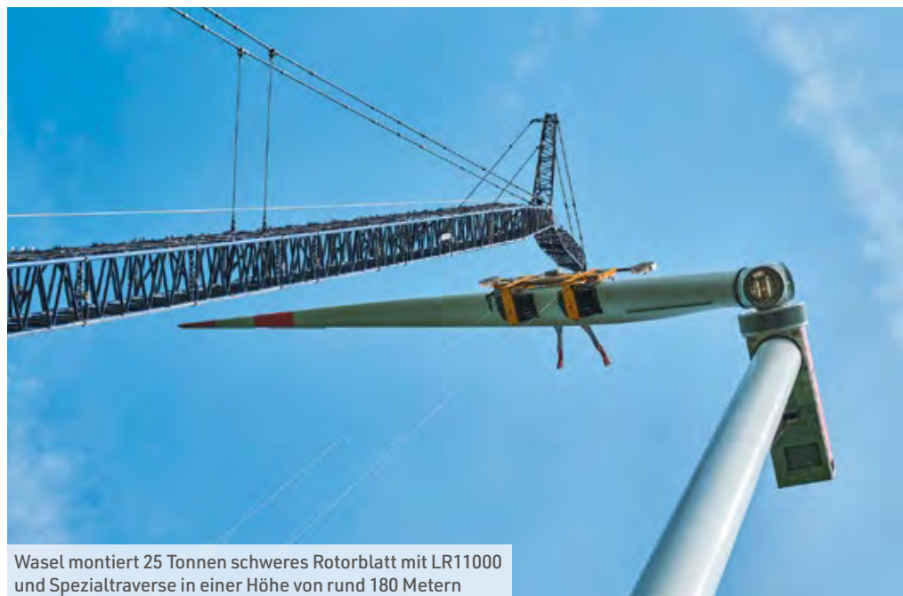
Wasel montiert 25 Tonnen schweres Rotorblatt mit LR11000 und Spezialtraverse in einer Höhe von rund 180 Metern

Bei einem weiteren Unternehmen aus der Alpenrepublik standen vor Kurzem große Umbau- und Hebearbeiten an. Die Firma Austro-Cel ist ein Traditionsunternehmen der österreichischen Zellstoffindustrie, das ebenfalls als Bioraffinerie aktiv ist. So werden neben Viskosezellstoff und Bioethanol auch Fernwärme und Grünstrom hergestellt. ➤