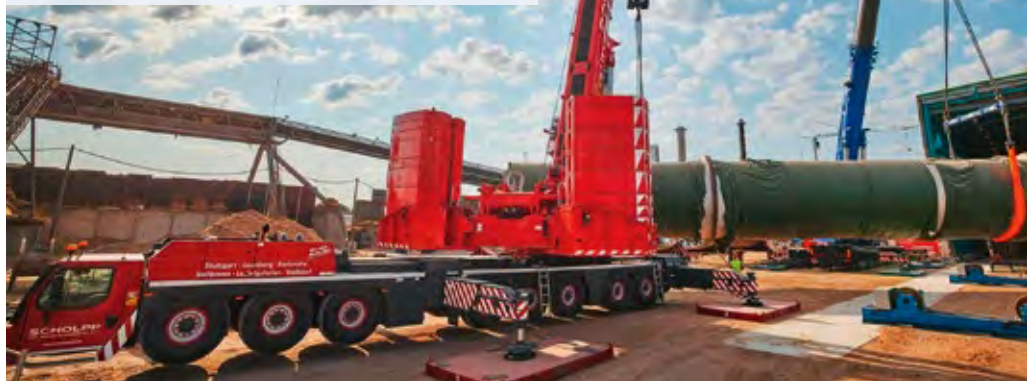
Scholpp hatte zwei LTM1650-8.1 in Golbey (F) am Start, um bis zu 176 Tonnen schwere Trommeln auszutauschen

Zum Einsatz kam hier erstmals die jüngste Errungenschaft des Prangl-Fuhrparks: der neue Liebherr LTM 1650-8.1 mit 700 Tonnen Traglast. Gerüstet wurde der 8-Achser mit einer TY-Abspannung, einem 69-Meter-Hauptausleger und 120 Tonnen Ballast. Im ersten Schritt wurde mit Hilfe eines 160-Tonnen-Teleskopkrans die Hallenwand in Höhe des Wärmetauschers geöffnet, gefolgt von der Montage einer Hilfskonstruktion. Anschließend wurde ein speziell konzipiertes Schienensystem installiert, welches das Ein- und Ausschleppen sowie das Anheben der Wärmetauscherpakete ermöglichte. Der exakt positionierte LTM 1650 hob zunächst kleinere Komponenten des alten Wärmetauschers heraus. Das Hauptpaket des alten Wärmetauschers wurde ausgeschoben und sicher vom Schwerlastkran entfernt. Danach wurde das neue Wärmetauscherpaket millimetergenau auf die Hilfskonstruktion gesetzt, eingeschoben und montiert. Dank der detaillierten Vorplanung und präzisen Vorbereitung verlief der Einsatz dem Unternehmen zufolge ganz nach Plan – ohne Überraschungen oder Verzögerungen. Ein zusätzlicher Auftrag, der durch das erfolg-