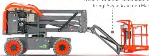
Neue E-Gelände-Gelenkbühnen bringt Skyjack auf den Markt