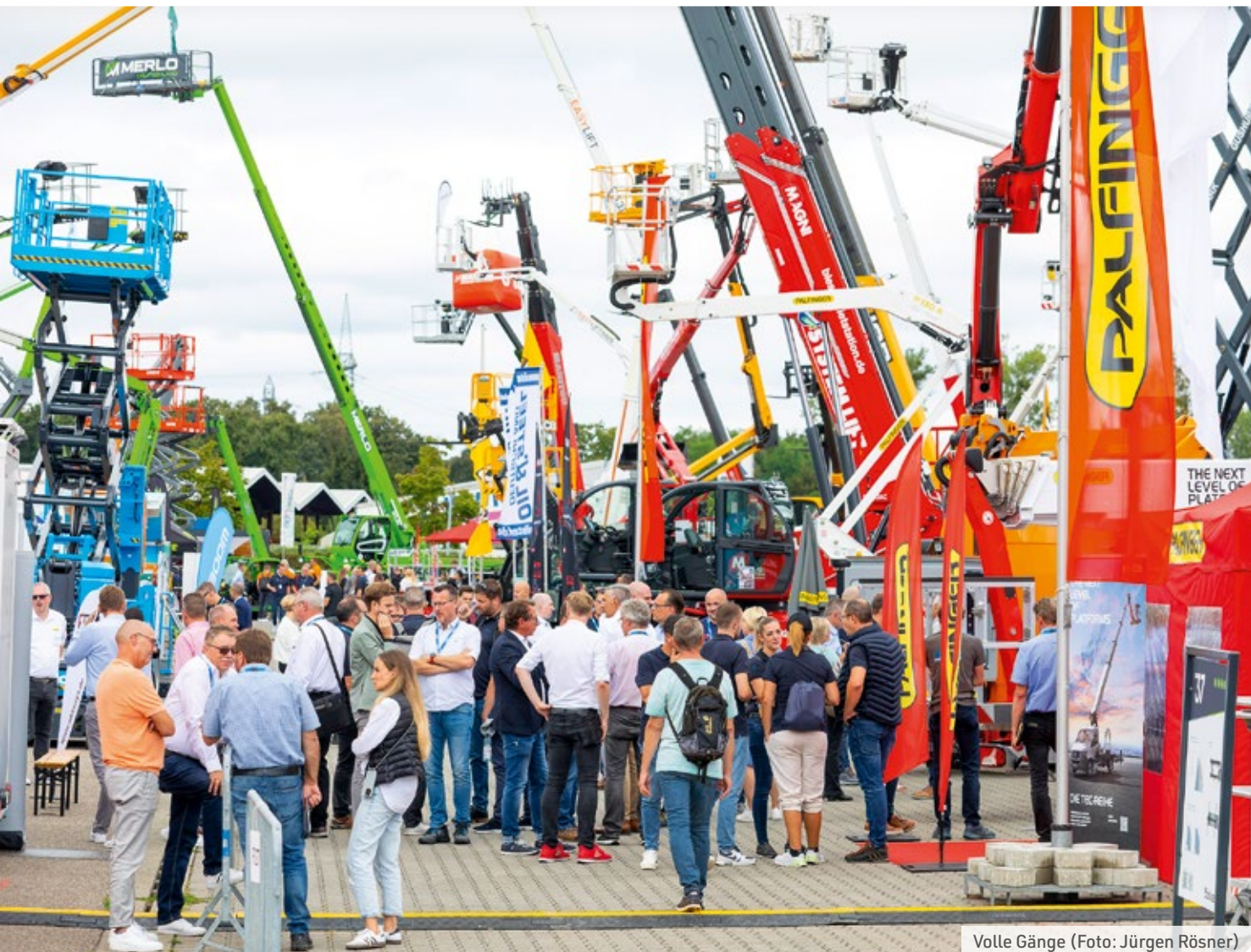
Volle Gänge

Potenzial nach oben. Um sich nicht im eigenen Dunstkreis zu verirren, hat die Messe bewusst Ausstellende und Besucher in einem Steuerungskreis hinzugenommen, „mit dem wir viele Themen vorangebracht haben“, erklärt Doll.