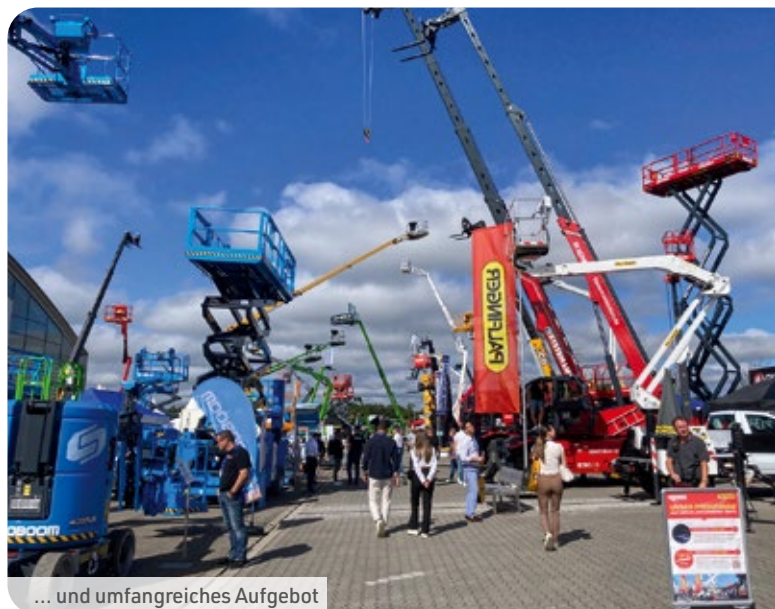
... und umfangreiches Angebot