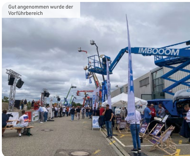
Gut angenommen wurde der Vorfühbereich