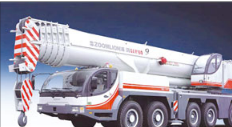
Chinas Nr. 1 bei den Mobilkranen ist Zoomlion

Entsprechend gut laufen die Geschäfte. Um gut 20 Prozent konnte Tadano den Umsatz im Geschäftsjahr 06/07 steigern. Vor allem in Europa und Nordamerika gingen die Verkaufszahlen steil nach oben.