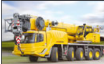
Weiterer Fünffachser von Grove, der GMK 5095