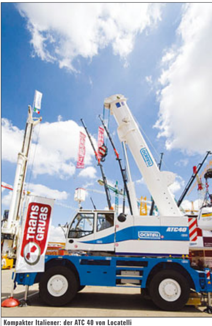
Kompakter Italiener: der ATC 40 von Locatelli

Neben diesen alteingesessenen Herstellern wagen sich auch Neue auf das Mobilkran-Terrain, allen voran die Chinesen. Die teilweise recht langen Lieferzeiten bis 2010 spielen neuen Marktteilnehmern natürlich in die Hände. Mit Abstand größter Kranhersteller Chinas ist XCMG. Die Palette reicht vom kleinen 25-Tonner mit zwei Achsen QAY 25 über Drei-, Vier- und Fünfachser bis hin zu den Siebenachsern QAY 240 und 300. Chinas Nummer zwei, Zoomlion, will den Export forcieren – im vergangenen Jahr hat der Hersteller etwa 750 bis 800 Mobilkrane exportiert – und sich auf die mittleren Traglastklassen konzentrieren. Dem Vernehmen nach sind ein 200- und ein 250-Tonner in der Pipeline. Und wie reagieren die Großen? „Immer einen Schritt voraus sein – mit Spitzentechnologie“, wie es ein Manager eines renommierten deutschen Herstellers formuliert.