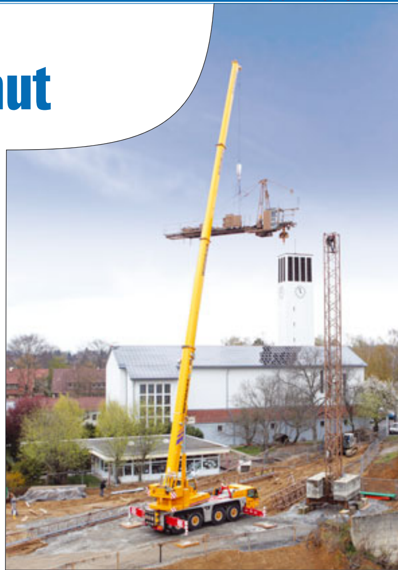
Wiesbauers AC 100/4 von Terex Demag im Einsatz

Zuletzt ging ein 500-Tonner an die Firma J. Bruns aus Hildesheim. Außer für Industriemontagen ist der neue Kran vor allem für die Errichtung von Türmen für Windkraftanlagen und den Austausch von Flügeln und Getrieben von Windkraftanlagen fest eingeplant. „Ich bin von der Leistungsfähigkeit des LTM 1500-8.1 über den gesamten Arbeitsbereich