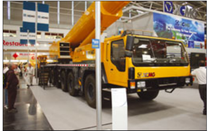
QAY240 von XCMG

ebenfalls mitgeordert, um den Kundenservice auch bei speziellen Einsätzen zu gewährleisten.