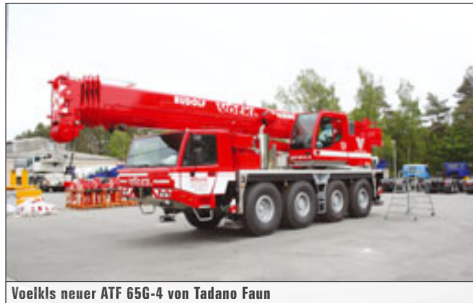
Voelkls neuer ATF 65G-4 von Tadano Faun

Derweil mausert sich der Großkran GTK1100 zum Exportschlager. Weltweit herrsche großes Interesse an dem Kran, hieß es seitens des Unternehmens. Bislang liegen Aufträge vor aus Mexiko, Brasilien, Spanien und Russland.