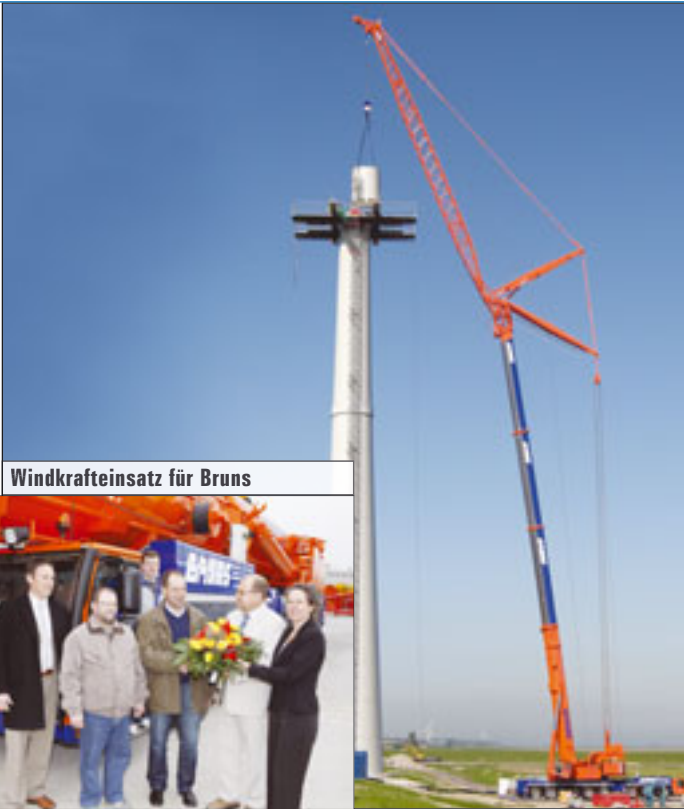
Windkrafteinsatz für Bruns

könne über flexible Strukturen (Zeitkonten, Leihkräfte) abgefangen werden, vielleicht bis 20 Prozent, so die Geschäftsleitung. Doch daran vermag im Moment keiner zu denken.