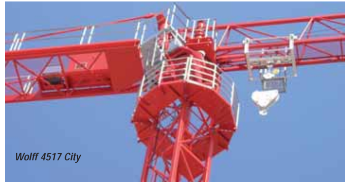
Wolff 4517 City