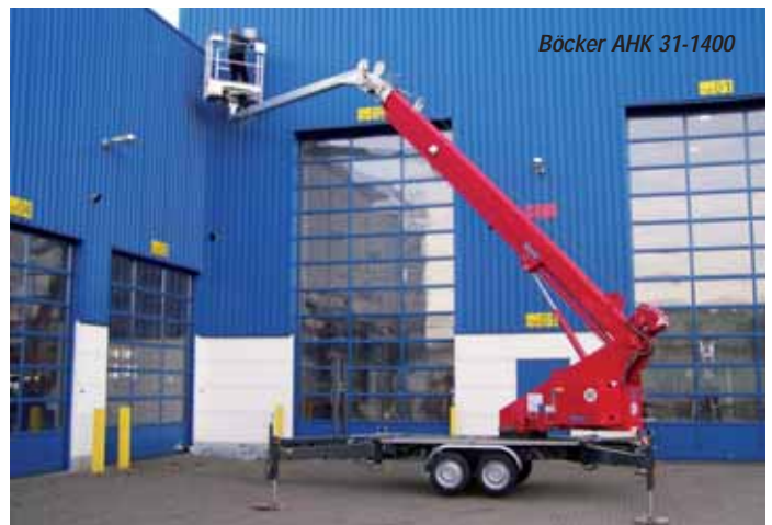
Böcker AHK 31-1400

Mini or compact cranes were still a very niche market at Bauma 2004 and trailer or aluminium cranes were principally a local German product. How things have changed.