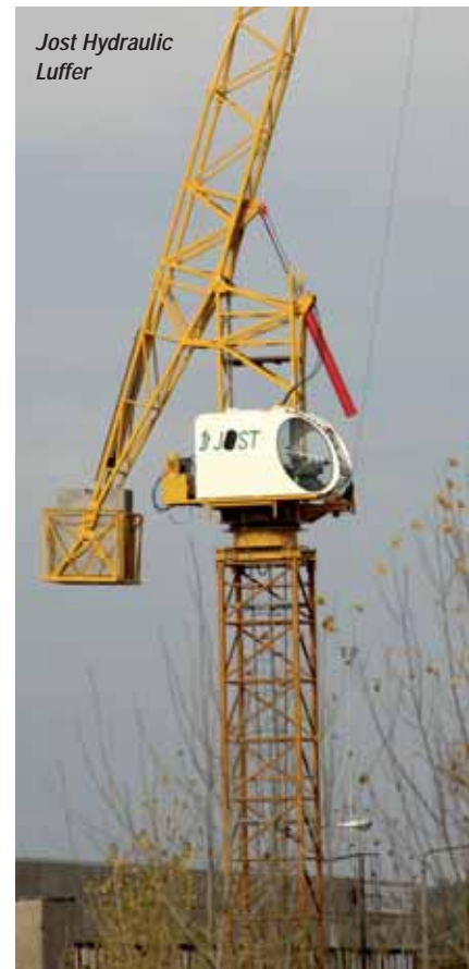
Jost Hydraulic Luffer