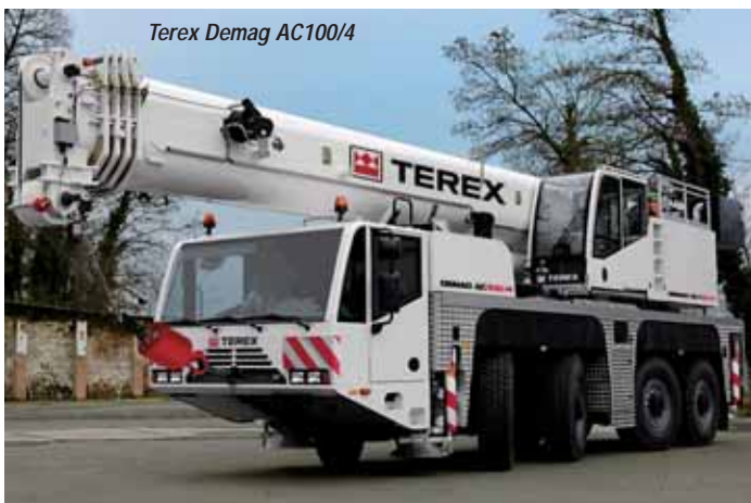
Terex Demag AC100/4

ATF80-4 which it replaces. The three axle 50 tonne ATF50G-3 with a 40 metre main boom beats its predecessor by six metres and finally the smallest of Faun's new All-Terrains is the two axle ATF40G-2 with a 35.2 metre boom. While on the stand have a look at the 55