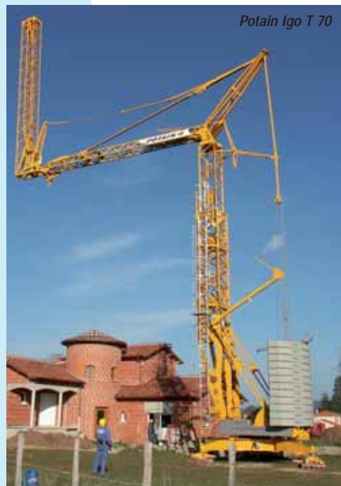
Potain Igo T 70

hook height. Head south to Wolffkran to take a look at a new luffing jib and two new 'L class' topless saddle jib cranes with 180 tonne/metre and a 224 tonne/metre capacities. A few stands further on are three manufacturers on the same corner - Eurogru with its self-erectors, Monta-Rent with tower cranes on a crawler chassis including the Montalift 102 S and Benazzato . Cross the aisle to stop at Jaso cranes and then in to Wilbert and look over its two new machines built with rental people for rental applications, Koenig Cranes is