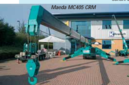
Maeda MC405 CRM

Funktion als Kran durch einen einfachen Umbau auch als vollwertige Hubarbeitsbühne genutzt werden können. Last but not least steht ein Abstecher ins Freigelände Nord an zu Riebsamen , bekannt für seinen Euro-Multi-Kran.