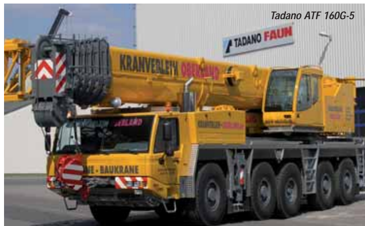
Tadano ATF 160G-5

Auch das jüngste Mitglied der Terex-Gruppe, Terex-Changjiang, stellt seinen neuen Vierachser LT 1050 vor. Die Reise geht weiter zum Nachbarstand, wo Sennebogen seine beiden Neuheiten in Sachen Mobilkrane präsentiert. Das Unternehmen hat sein Modell 613 komplett überarbeitet und stellt zudem ein völlig neu entwickeltes Modell 643 vor. Von hier aus führt ein Abstecher ins nördliche Areal, wo sich unter anderem die chinesischen Hersteller Sany und Zoomlion finden, nur wenige Blocks weiter präsentiert sich das indische Unternehmen ACE , das unter anderem Pick and Carry-Krane im Portfolio führt. Im äußersten Nordwesten informiert Cams über seine Industriekrane der Marke Bencini. Nach diesem Ausflug geht es zurück in das