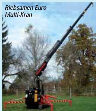
nach Norden, in Richtung Messehallen, wo Sie Imai erwartet. Das italienische Unternehmen hat unter anderem eine Auswahl seiner Mini-Raupenkrane mit nach

Kleine Krane, große Wirkung - oder: kleine Ausstellerliste in diesem Segment, aber große Runde über das Messegelände. Wenn Sie sich in südöstlicher Richtung orientieren, stoßen Sie als erstes auf die Miniraupenkrane des italienischen Herstellers Kegiom . Zusammen mit Tele-Mini Lifttechnik, der Generalvertretung für Deutschland und Österreich, wird das brandneue Modell E 350 Plus präsentiert. Mit einer Kapazität von 2050 Kilogramm besitzt dieser „Mini“ eine maximale Abstützbreite von schmalen 1,70 Metern. Dem Hersteller zufolge ist dies „die schmalste Abstützbasis bei vollen Tragwerten, die bisher ein Minikran erreicht hat“. Setzen Sie Ihren Rundgang weiter in Richtung Südosten fort, und Sie landen bei Maeda . Hier werden Minikrane aus japanischer Produktion ausgestellt. Noch einen Tick weiter südostwärts geht es, bis Sie bei Unic ankommen. Hier begegnet Ihnen eine Neuvorstellung, und zwar der Miniraupenkran 706. Jetzt heißt es, sich nach Nordosten zu orientieren und den Stand von Albert Böcker anvisieren. Das deutsche Unternehmen stellt den neuen Anhängerkran AHK 31/1400 in Alu-Leichtbauweise vor. Seine Besonderheit: Er kann auch als Bühne eingesetzt werden. Verschiedene Anhänger- oder auf LKW-Fahrgestellen aufgebaute Aluminium-Krane mit Förderhöhen zwischen 25 und 41 Meter komplettieren das Angebot. Schlagen Sie nun einen weiten Bogen nach Westen und auch