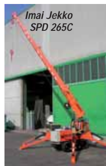
Imai Jekko SPD 265C

This unit has been designed to convert easily into a telescopic work platform. The German based producer offers trailer and truck-mounted aluminium cranes with booms from 25 to 41 metres. Head back to the Halls where you will find Imai in B3. The company is showing its new Gecko range of mini cranes and is also known for its custom-built mini cranes. Now head back outside to area F5 where you will find Hermann Paus . Its SkyWorker aluminium trailer crane offers a full EN280 working platform. Finally head over the road to the North area and F7N to find Riebsamen with its locally produced 'Euro-Multi-Crane'.