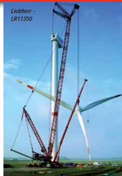
Liebherr - LR11350

Tonnen Tragkraft als nächstes auf der Tour begegnen kann. Benachbart sind die Geräte von Nobas zu finden, die zumeist in die Kategorie Seilbagger einzustufen sind. Der Weg Richtung Süden geht zuerst am Stand von CMV mit seiner TL-Baureihe vorbei, bevor mit Manitowoc noch mal ein Highlight in Sachen Raupenkrane erreicht