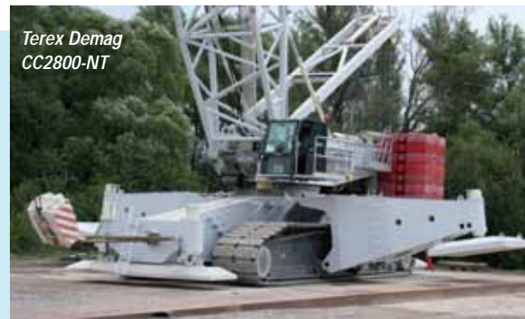
Terex Demag CC2800-NT

Finally we head to the bottom corner of the outside area where we find the Japanese manufacturers, Hitachi Sumitomo and Kobelco . Hitachi is launching its 120 tonne SCX1200-2 onto the European market and will show its SCX400 telescopic crawler. Kobelco , which claims European market leadership, has an impressive display with its new 600 tonne SL6000 with Super Heavy Lift, the first two of which are destined for Weldex in the UK. The SL600 will sport 170 metres of boom and jib. The 60 tonne CKE600 launched last year will also be on show along with the BME800HD heavy duty foundation crane.