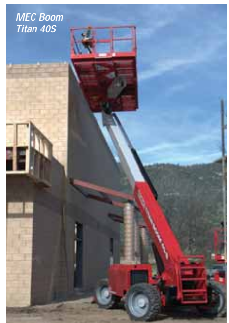
MEC Boom Titan 40S

and a lower total weight than any other manufacturer - quite how is something of a mystery but it works. Finally we have listed Manitou and Tadano, both of which produce boom lifts, but neither will be exhibiting them here at the show.