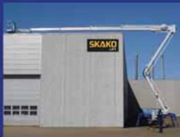
FS105-Z - 52 ft reach