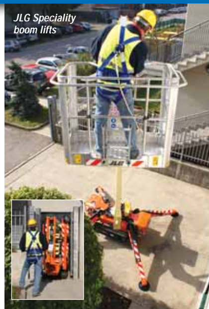
JLG Speciality boom lifts

compact crawler booms with working heights of 45, 61 and 75ft respectively. For those of you familiar with Hinowa products these are basically the 14:72, 19:65 and 23:12 Lightlift models. JLG has put a good deal of effort into this programme and the products themselves are far more rugged than they may look - most definitely worth a closer look. Towards the Tadano stand you'll find a new Oil & Steel 50ft working height Octopussy 1500 Evo. This company was a pioneer of compact spider lift development and is looking to regain that position. Now we sweep over to Silver Lot 4, where you will find the Omme 3000R telescopic model. Built in Denmark it boasts 99ft of working height in a compact and lightweight package. Next door is Niftylift, which makes a rather different kind of tracked lift - heavier more rugged and not quite as compact as some of the others. Its design its rugged simplicity however has an appeal. Head towards IPAF's Lift Safety Zone with its ground condition demonstrations turning left to Teupen where you'll find one of the world's largest lifts of this type, the