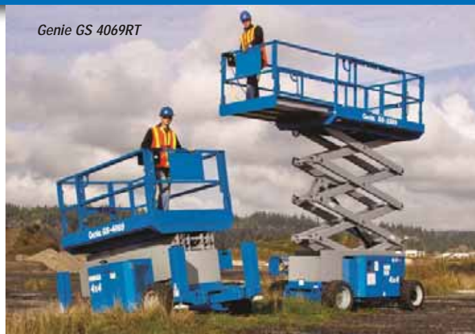
Genie GS 4069RT

Rough Terrain scissor lifts. The three model line-up includes the GS 2669RT, 3369RT and 4069RT with more power, larger decks and improved scissor linkage. Across the aisle is Skyjack , although not planning a new product launch do check out the SJ12 and SJ16. Now cross the Link Belt stand to Snorkel which plans to unveil a new 60ft standard duty Rough Terrain scissor. The S6090RT boasts an extended platform length of 7.3 metres/24ft with 568kg/1,250lbs platform capacity. On the same stand take a look at