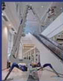
Falcon 85-172 ft