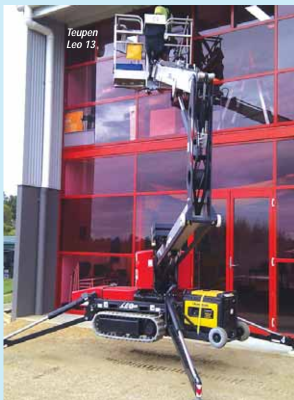
Teupen Leo 13

stand de Tadano encontrará un nuevo Oil & Steel de 50 pies de altura de trabajo, la Octopussy 1500 Evo, esta empresa fue pionera del desarrollo compacto de elevación de araña y está tratando de recuperar esa posición. Ahora vamos al Silver Lot 4, donde está la araña telescópica Omme 3000R, construida en Dinamarca, que cuenta con 99 pies de altura de trabajo. Al lado está Niftylift, que hace arañas más fuertes y no tan compactas como el resto. Vaya hacia la zona de IPAF de seguridad con sus demostraciones en tierra, girando a la izquierda ve Teupen, donde puede encontrar una de las arañas más grande del mundo, Leo 50GTX con 165 pies de altura de trabajo. En el otro extremo, la Leo 13. Por último, un salto al Blue Lot, para ver a Skako. La compañía está lanzando el FS320Z, de 106 pies de altura de trabajo, y que era un prototipo en Bauma. Aquí están las remolcables Denka. También encontrará Socage en el Blue Lot, pero no tiene la intención de mostrar su nueva gama de arañas aquí.