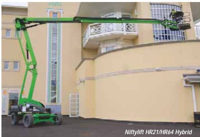
Niftylift HR21/HR64 Hybrid

We start our tour in the Gold Lot at the JLG stand where the new boom models are plentiful. The first unit to catch your eye will surely be the 150ft straight boom with telescopic articulating jib.