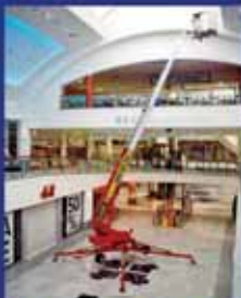
Denka 72-92 ft