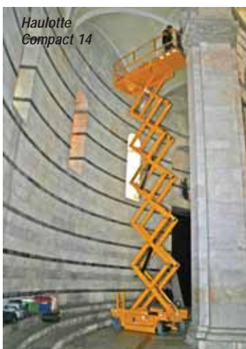
Haulotte Compact 14

A few steps towards Kobelco brings you to low level master - Custom Equipment with both self-propelled and push around scissor lifts. Check out the 8ft platform height HB-830 - a fully-fledged self-propelled scissor lift complete with roll-out deck. Turn